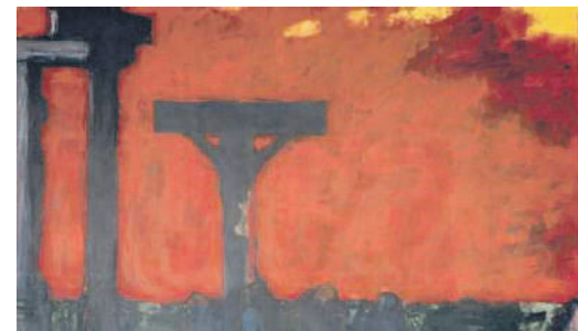
Altertavle, Røgen kirke

stiller spørgsmålstegn ved opstandelsen og dens betydning.