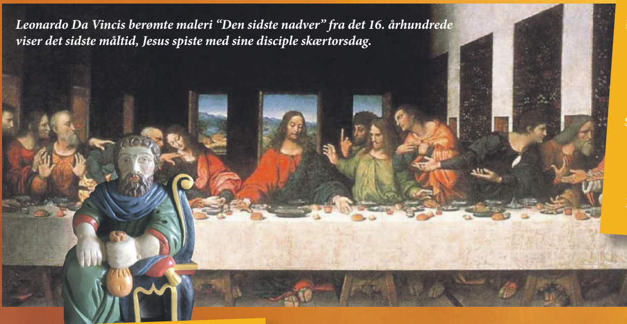
Leonardo Da Vincis berømte maleri "Den sidste nadver" fra det 16. århundrede viser det sidste måltid, Jesus spiste med sine disciple skærtorsdag.

Ved samme måltid bliver Jesus forrådt af Judas for 30 sølvpenge.