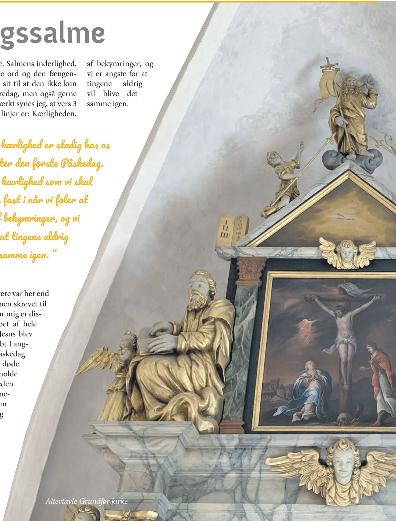
Altertavle Grundfør kirke