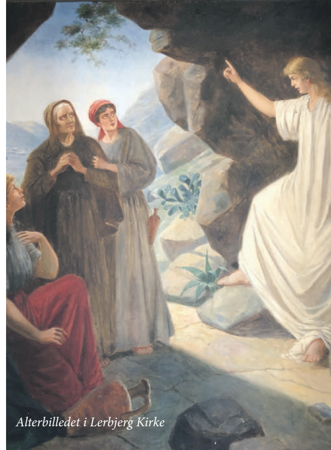
Alterbilledet i Lerbjerg Kirke

vi nærmest ikke ved, hvad vi skal gøre af os selv, for selv håbet synes udsat på ubestemt tid. Vi har ingen dato for, hvornår denne på én gang meget uvirkelige og samtidig alt for virkelige tid ender.