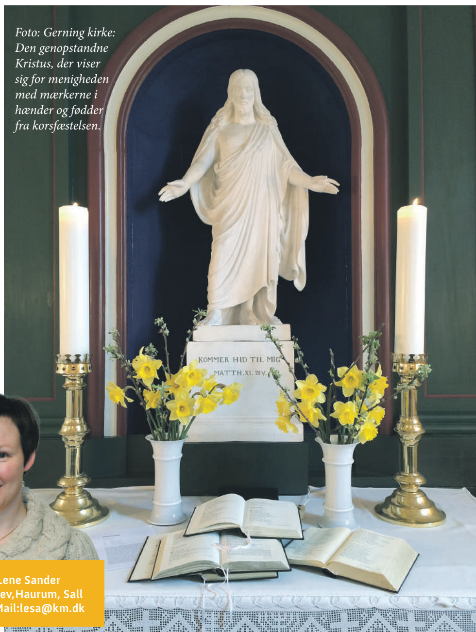
Foto: Gerning kirke: Den genopstandne Kristus, der viser sig for menigheden med mærkerne i hænder og fødder fra korsfæstelsen.